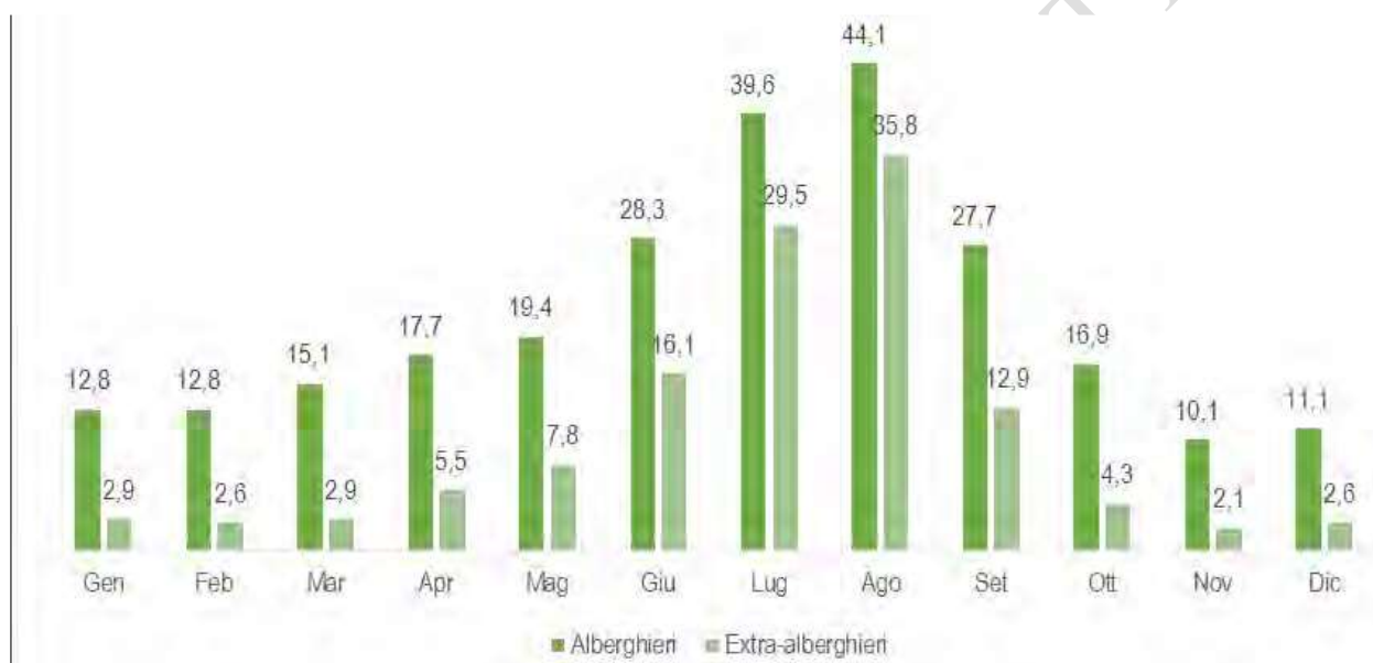
Graf. 36 – Presenze alberghiere ed extralberghiere nei vari mesi dell'anno 2012. Valori assoluti in milioni.

La distribuzione complessiva dei flussi nell'anno 2012 conferma una condizione strutturale del sistema di ospitalità del Bel Paese. Nei mesi estivi, da giugno a settembre, si concentra la massima affluenza dei clienti, con il 61,5% delle presenze e con punte di affollamento nei mesi di luglio (18,1%) e agosto (21,0%), tradizionalmente definiti di alta stagione turistica.