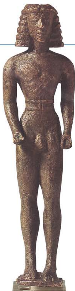
↑ 33 Kouros (da Delfi), 650 a.C. circa, bronzo, h 19 cm, Delfi, Archaiologiko Mouseio.

Il kouros è la figura maschile nuda con le braccia lungo i fianchi, i pugni chiusi e una gamba leggermente avanzata. Questo modello deriva direttamente dalla statuaria egizia.