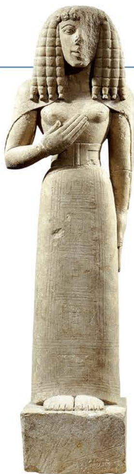
↑ 31 Dama di Auxerre (da Creta), 650-600 a.C., pietra calcarea, h 75 cm, Parigi, Musée du Louvre.