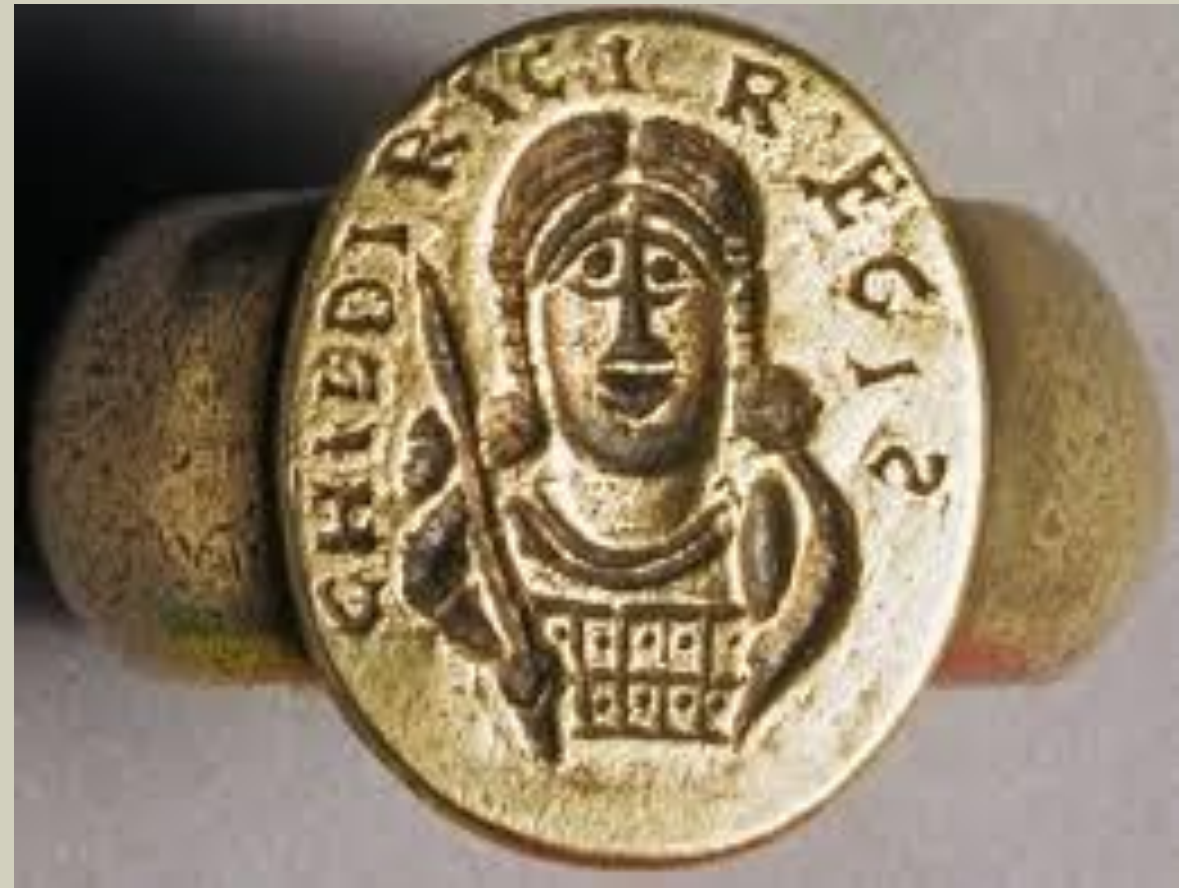
Medaglia di Teodorico (a sinistra) e anello-sigillo di Chludericus (a destra)