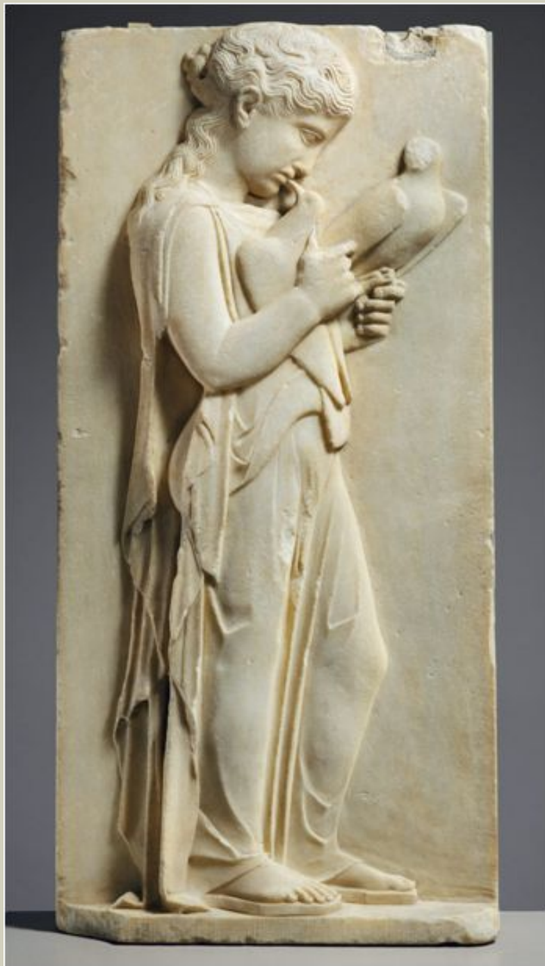
Stele funeraria di una bambina, da Paros, 450-440 a.C.