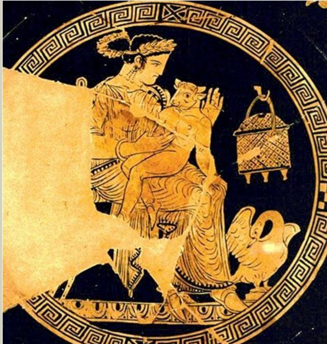
Kylix apula a figure rosse: Pasifae col piccolo Minotauro in braccio, IV sec. a.C.