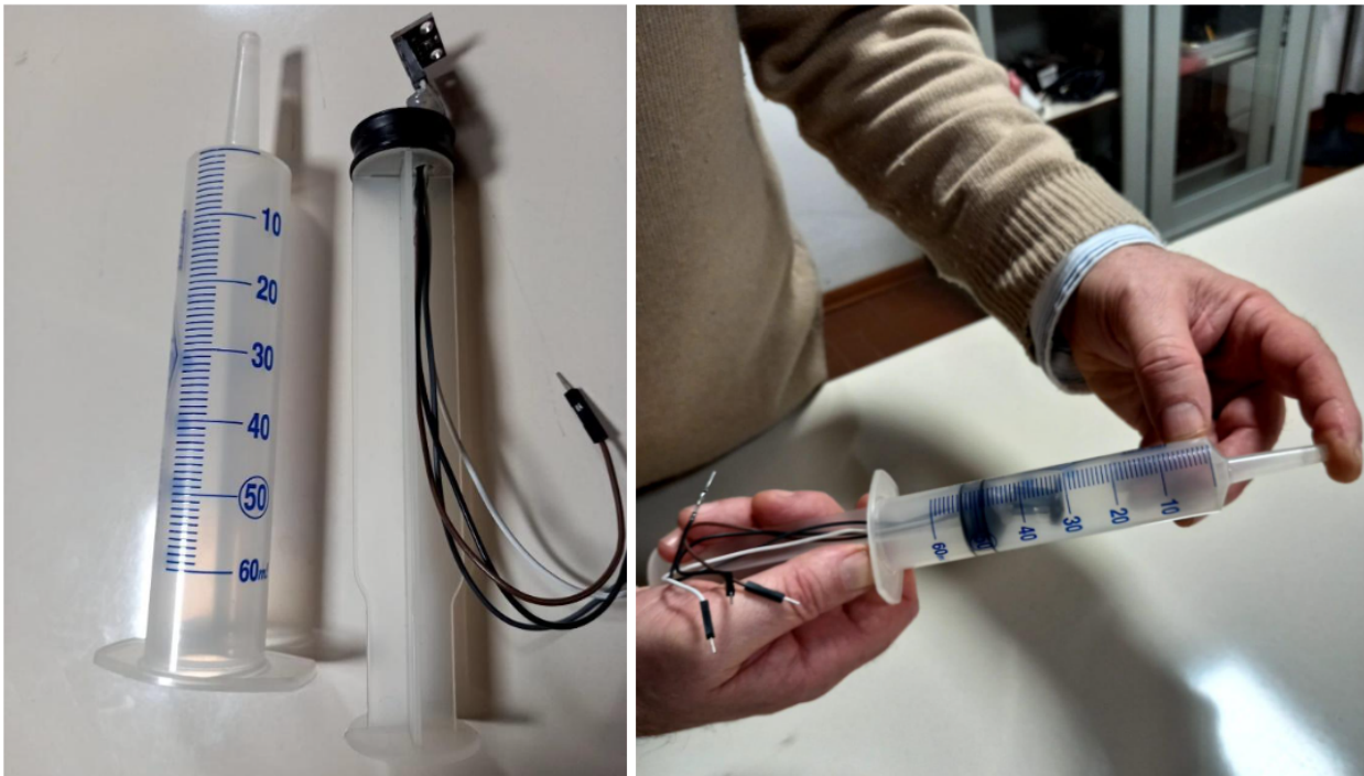
Figura 3: Esempio di una siringa modificata con aggiunta di sensore termobarometrico sullo stantuffo, utile per lo studio delle leggi dei gas