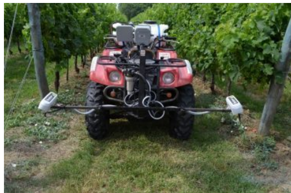
Attrezzatura per il diserbo chimico.

Oggi le crescenti attenzioni ambientali verso l'uso della chimica stanno favorendo la riscoperta delle lavorazioni del terreno lungo la linea del filare; tali lavorazioni hanno anche il vantaggio di interrompere la risalita capillare dell'umidità del terreno preservandone la dotazioni idrica che, in un periodo di forti emergenze climatiche, è sicuramente positivo.