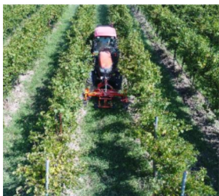
Lavorazione lineare esterna al filare

La gestione del suolo sulla fila viene realizzata principalmente per contenere lo sviluppo di essenze infestanti, preservare la dotazione idrica del terreno e contenere i fenomeni di erosione nei terreni collinari. Il controllo delle infestanti può essere realizzato con le lavorazioni , con varie tecniche di diserbo e con la trinciatura . La lavorazione è stata la prima soluzione a essere applicata con fresature o scalzatura e rincalzatura a mezzo dischi. La successiva introduzione del diserbo chimico ha decretato la forte riduzione della diffusione della lavorazione a favore di questa tecnica più economica per la sua rapidità e praticità di esecuzione e il modesto numero di interventi richiesti nel corso di una stagione.