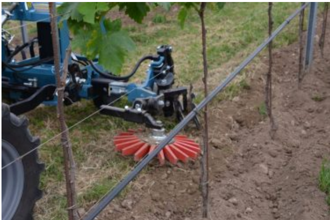
Stelle rotanti verticali e orizzontali.