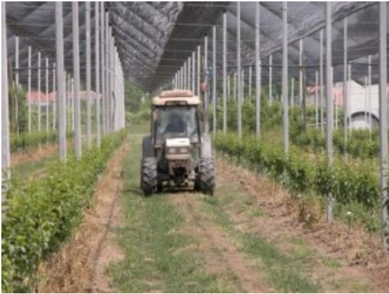
L'inerbimento interfilare assicura portanza al transito dei mezzi meccanici.