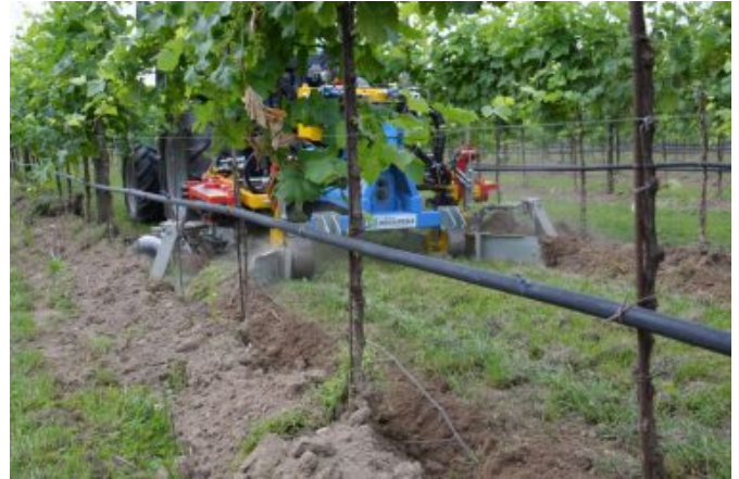
Dischiere scalzanti bilaterali.