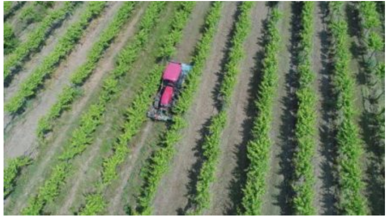
Lavorazione anteriore con coltello scalzante in combinata con trinciatura interfilare.