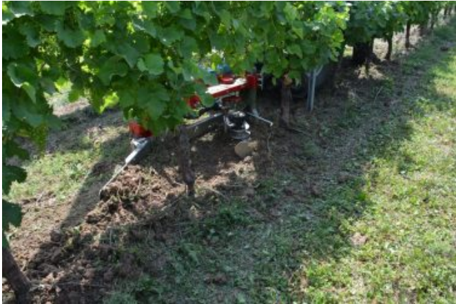
Coltello scalzante interceppo.

Meno diffuso è l'impiego di diserbatrici a filo o trinciatrici rientranti ; le prime permettono velocità di lavoro più elevate ma entrambe, operando uno sfalcio del cotico erboso, non preservano l'umidità del terreno ma contengono, tuttavia, fenomeni di erosione in terreni collinari. Negli ultimi tempi si stanno sperimentando varie soluzioni di diserbo basate sull'uso di pressione, vapore, fuoco o schiume che, rispetto al diserbo chimico, offrono indubbi vantaggi ambientali anche se sono più complesse da applicare e non preservano l'umidità del terreno.