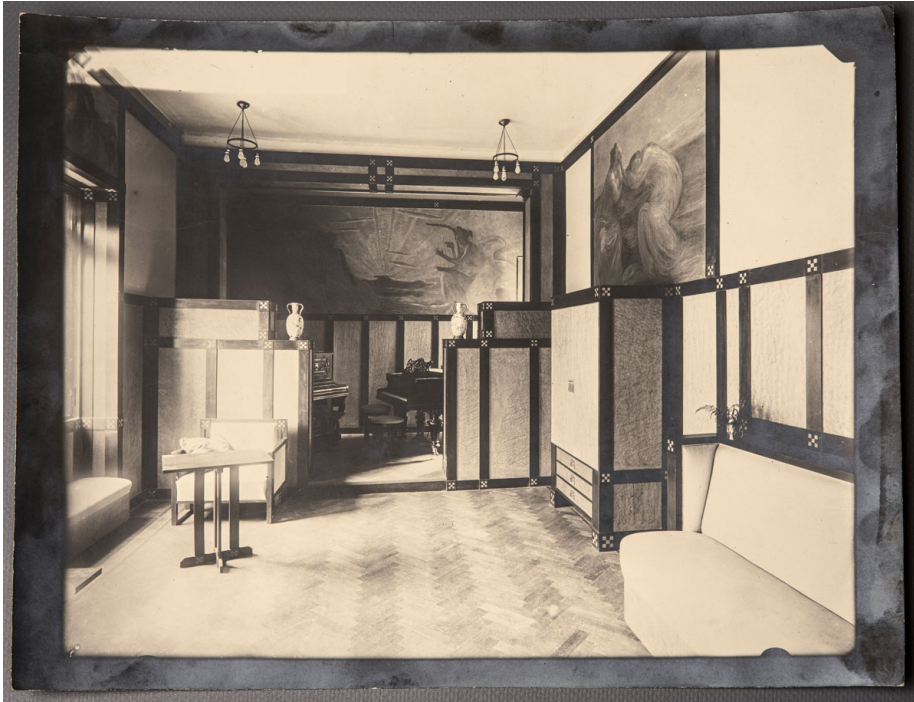
Fig. 1. Sala da musica nell'abitazione di Alberto Grubicy in via Ravizza a Milano, 1908.

morte del gallerista). Gaetano Previati dipinge su commissione di Grubicy, tra il 1907 e il 1908, un ciclo di sei tele dedicate al tema della musica per il villino in via Ravizza a Milano, oggi non più esistente e una fotografia del 1908 presenta la sala allestita con una serie di arredi contemporanei chiaramente influenzati dalle invenzioni secessioniste [Fig. 1]. La boiserie che incornicia le tele previatesche e scandisce lo spazio della sala, i pannelli che separano lo spazio con i pianoforti dalla sala vera e propria, i mobili a parallelepipedo con le maniglie rettangolari a scomparsa, le sedute basse e quadrangolari, il tavolino a base pieghevole, il tutto scandito dal motivo ornamentale "ad quadratum" (cinque quadrati bianchi intarsiati su un legno ebanizzato): tutto rimanda a Hoffmann e a Vienna, anche se gli arredi furono realizzati, con ogni probabilità, a Milano, forse dalla ditta "Quarti" o da "Ceruti" (7).