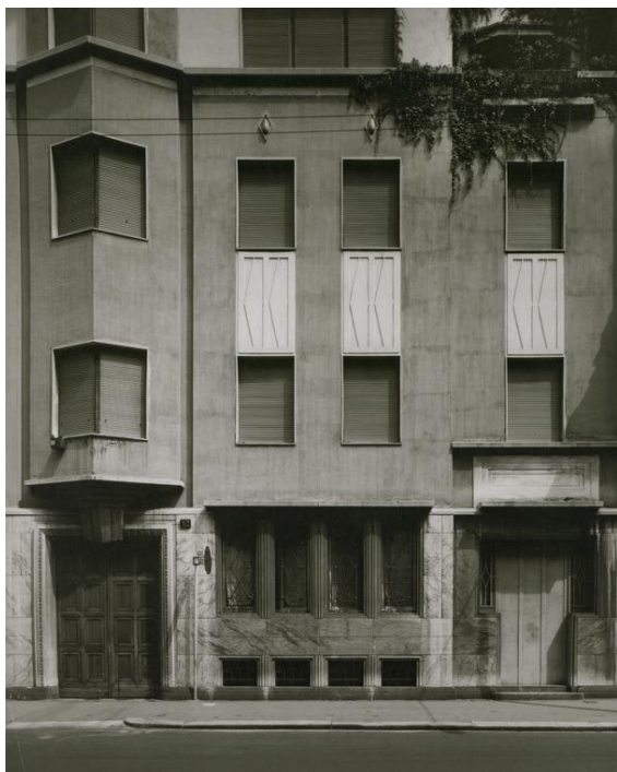
Fig. 3. Giovanni Greppi, Casa già in via Statuto 12, Milano, 1919.