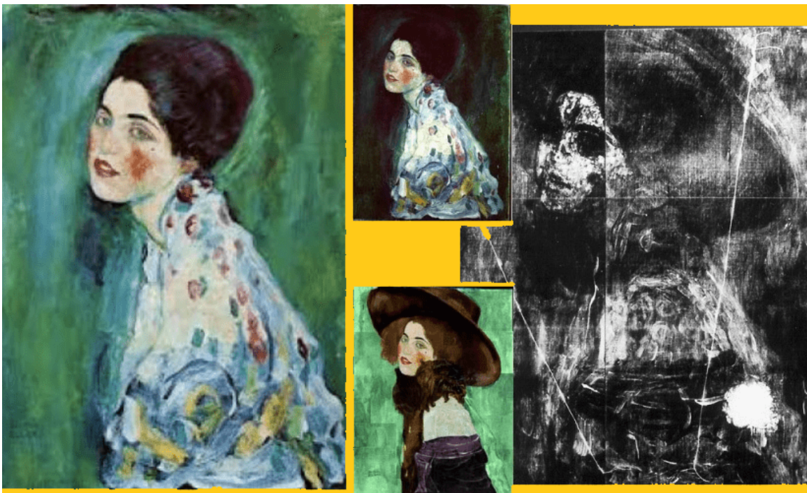
Klimt, Ritratto di signora, 1917 (a sx opera più recente, a sx e al centro radiografia e opera al di sotto datata 1912)