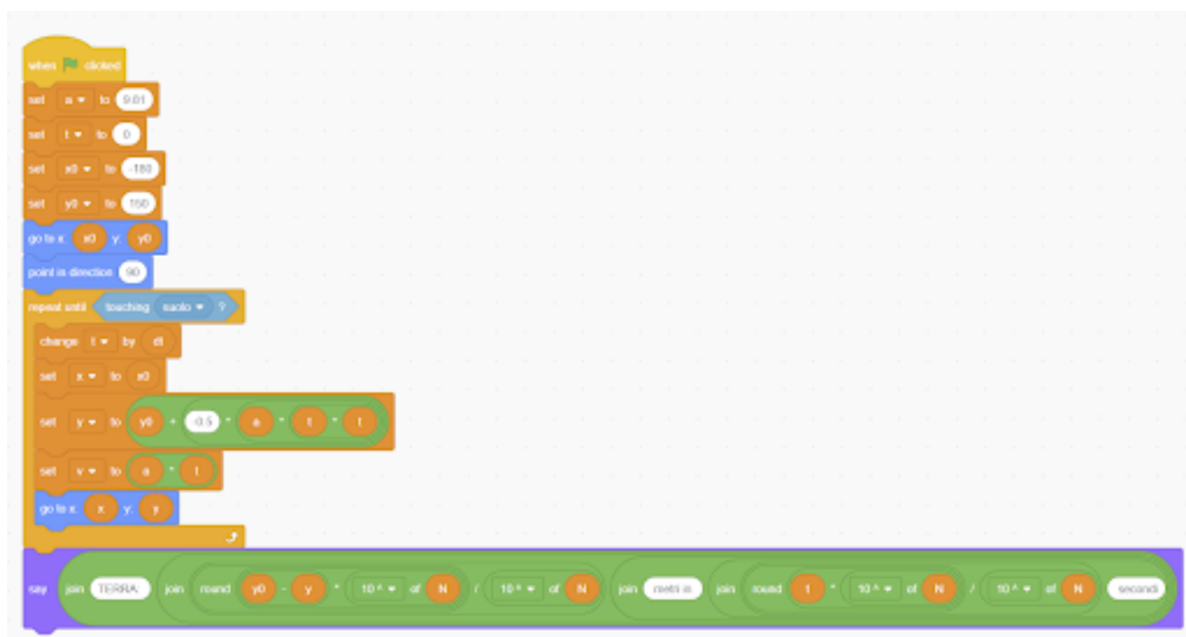
Un blocco di codice Scratch! per simulare la caduta di un oggetto sulla Terra

Un'attività non banale potrebbe prevedere la realizzazione di un videogioco in cui le leggi della fisica sono diverse da quelle del mondo reale.